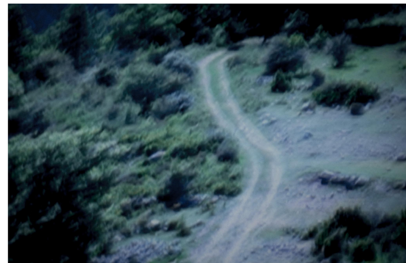
'We zaten aan de rand van de Pyreneeën. Op het einde was er die ene foto. Precies menselijke krassen in het landschap.'